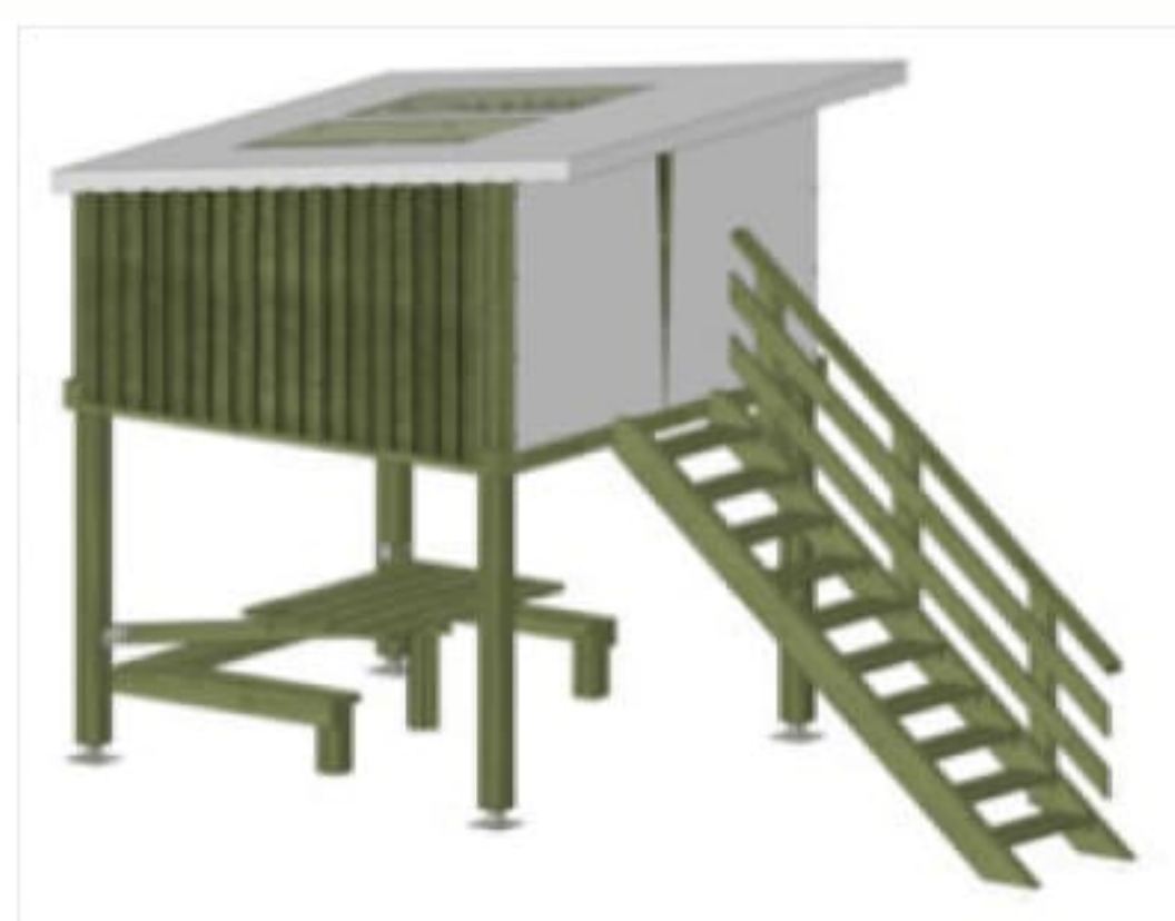
Campétoile (sol filet) - 4m 2