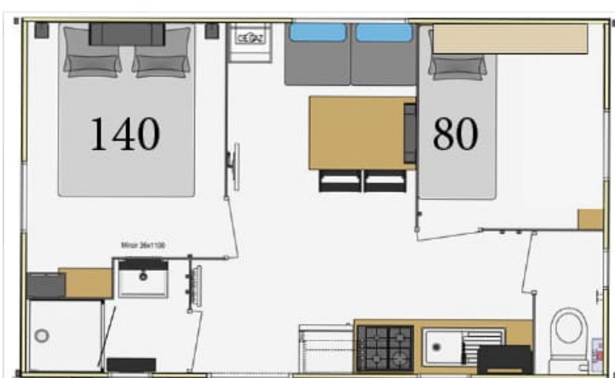
Nénuphars 1 à 4 & 7 à 10 Pétunias 1 à 4 - 24m 2