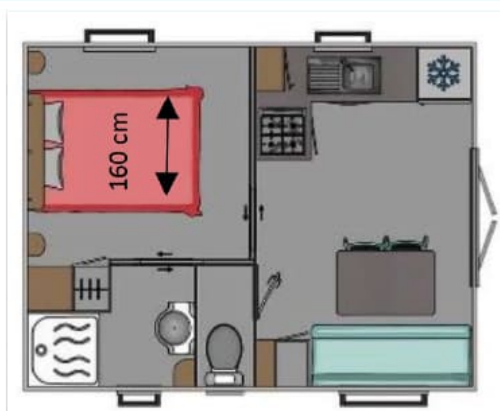
Lys 1 & 2 - 22 m 2