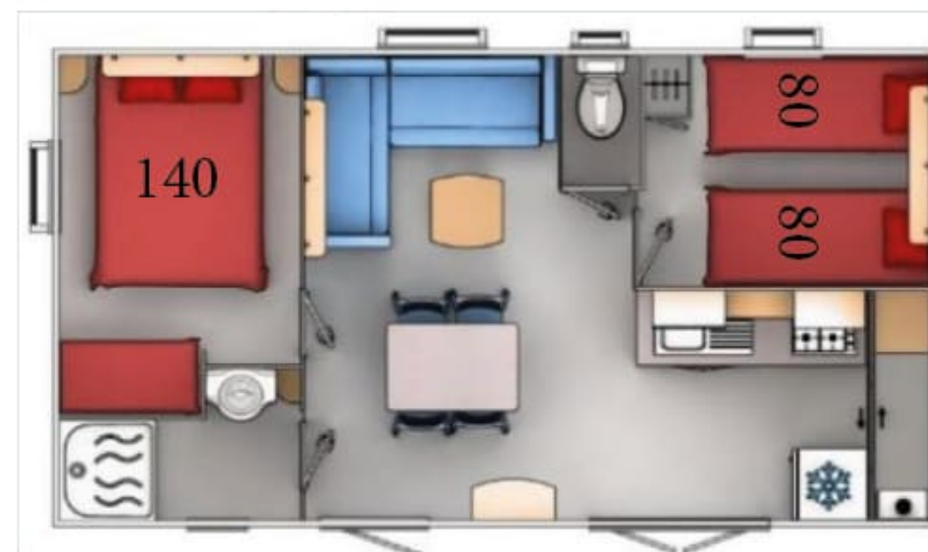
Pâquerettes - 29 m 2