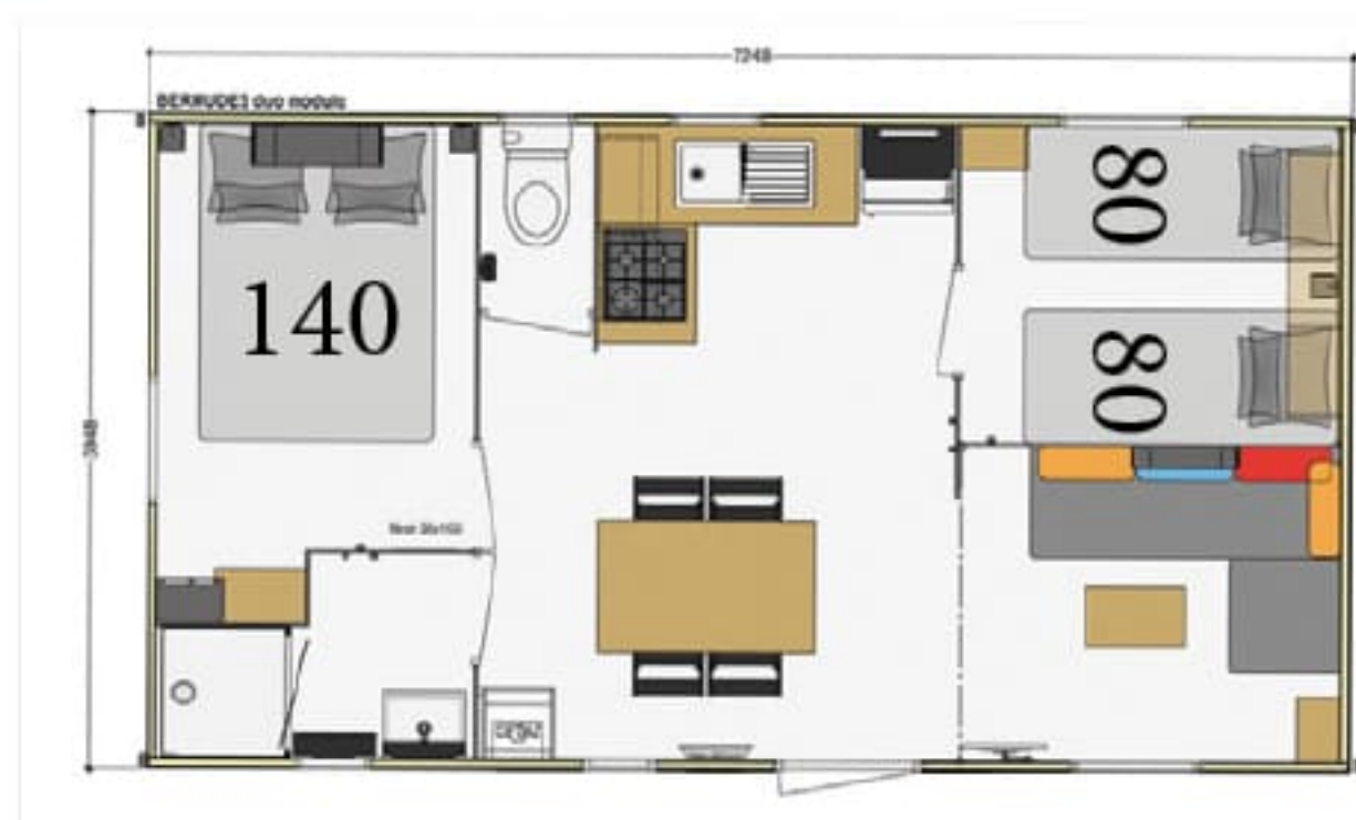
Tulipes 5 & 6 Nénuphars 5 & 6 - 27m 2