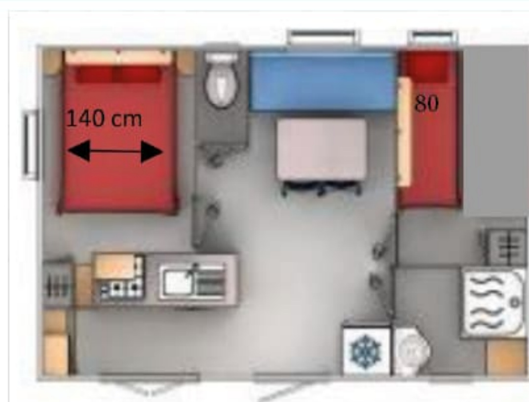
Lys 3 à 15 - 24 m 2