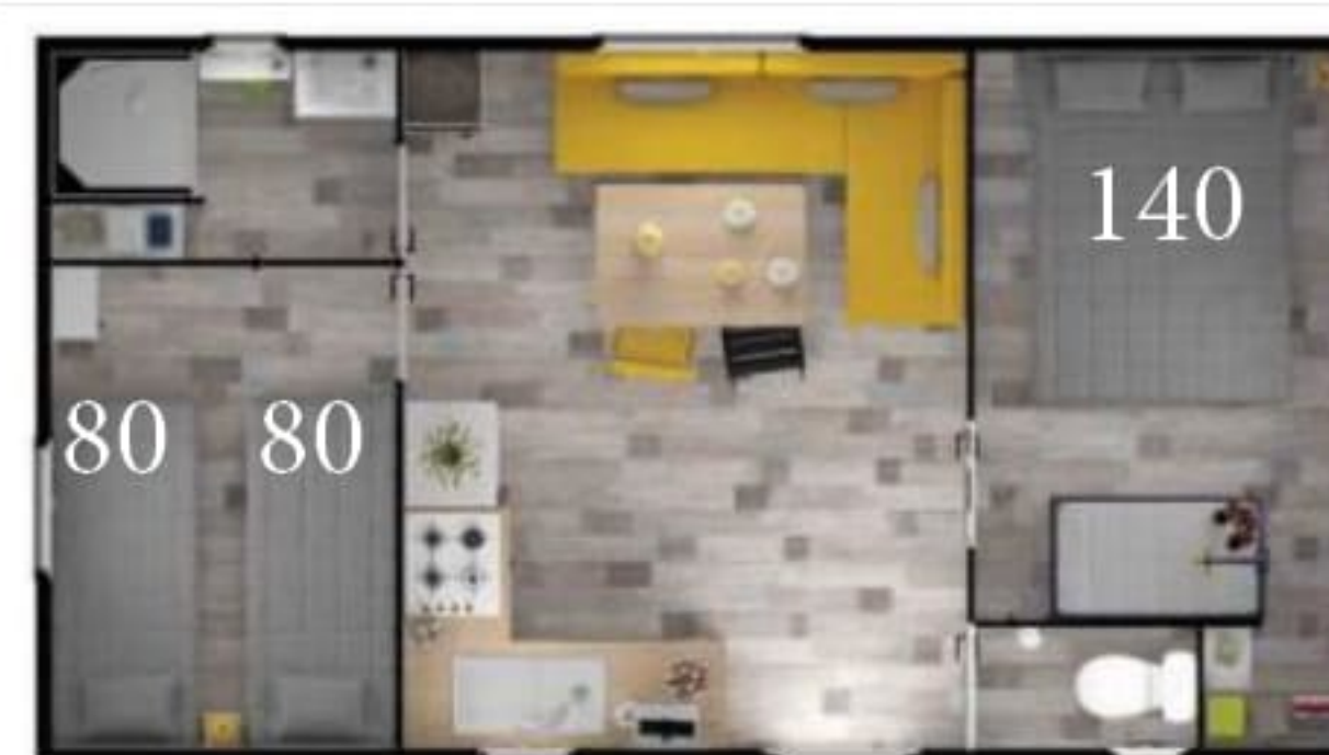
Tulipes 1 à 4 - 27 m 2